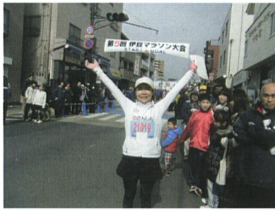
伊豆マラソン ゴール

昨年11月の新東名マラソン、今年2月の伊豆マラソンの10キロに初めて挑戦。どちらも全国からエントリーしてきた参加者が殺到し、マラソンの人気沸騰ぶりを改めて認識しました。