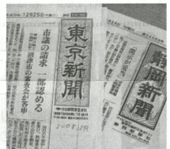
大きく取り上げられた 新聞記事！

その結果、門池小学校に隣接した一戸建てを借り整備し、今年10月に受け入れを確保した放課後児童クラブがオープンする。