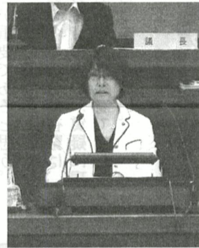
市長答弁において