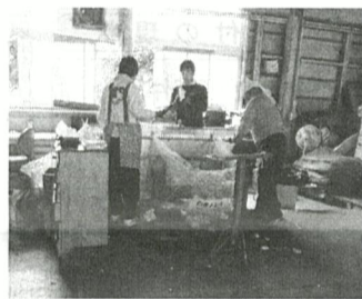
障がい者の工賃の現状と地方自治法施行令改正に伴う随意契約による市の業務委託について

きることは安定的な仕事を確保できるわけで、それが生きていく上での支えにつながる。障がい者の工賃の現状と地方自治法施行令改正に伴う随意契約による市の業務委託に